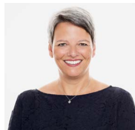
Corinne Ullmann Stadtpräsidentin Stein am Rhein

Einmal mehr lohnt es sich, zum nordArt nach Stein am Rhein zu kommen, um hier zu lachen, sich zu wundern, zu geniessen und sich zu freuen.